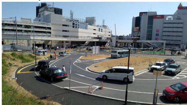
手前にA街区再開発事業用地（現在仮説交通広場） 写真奥が工事中の駅前交通広場（3月15日撮影）