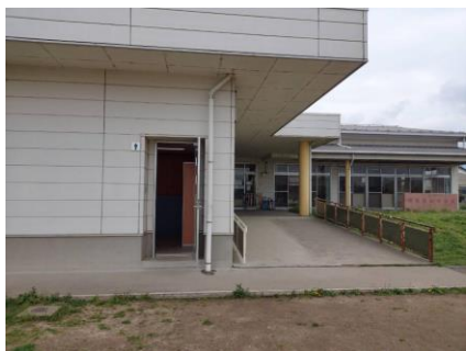
奥にクラブ室、手前角に子どもが利用する外トイレ クラブ室から死角の為、手前右側に支援員が立哨見守り

れ、いずれも全員賛成で採択されています。 クラブ室からトイレが見えないため防犯上支援員を1名多く配置して見守っていますが、雨の日も雪の日も靴に履き替えて外のトイレを利用しています。当初から、支援員はもちろん子ども達からも「部屋の中にトイレをつくって！」と言われていました。 この間、クラブ室の改善要望を受けて、地域の1級建築士のアドバイスで『吸音天井板』に替え、室内に手洗い場を設置させてきました。引き続き、子ども達が安心して楽しく過ごせるように取り組みます。