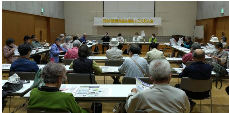
共産党議員団による議会報告と懇談会に参加した市民ら 4月13日、福祉交流センター

4月13日、3月市議会報告と市民との懇談会が、久賀公民館と福祉交流センターで開催されました。参加者は合わせて60人。4人の市議の報告を受けて、熱心に質疑・要望が出されました。今後の活動につながる実り多い会になりました。