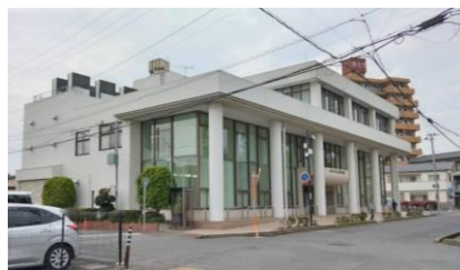
取手駅前への移転方針が突然発表された現在の取手図書館

その後戻った。 Q 西口開発の問題は、取手市のまちづくりの問題。一極集中ではなく、日頃使っている公民館を使いやすくきれいにしてほしい。 A 市の一方的なものではなく、市民の声が活かされる駅前整備とまちづくりへ、図書館は市民要望にそった目的にふさわしいものへ、力を合わせます。