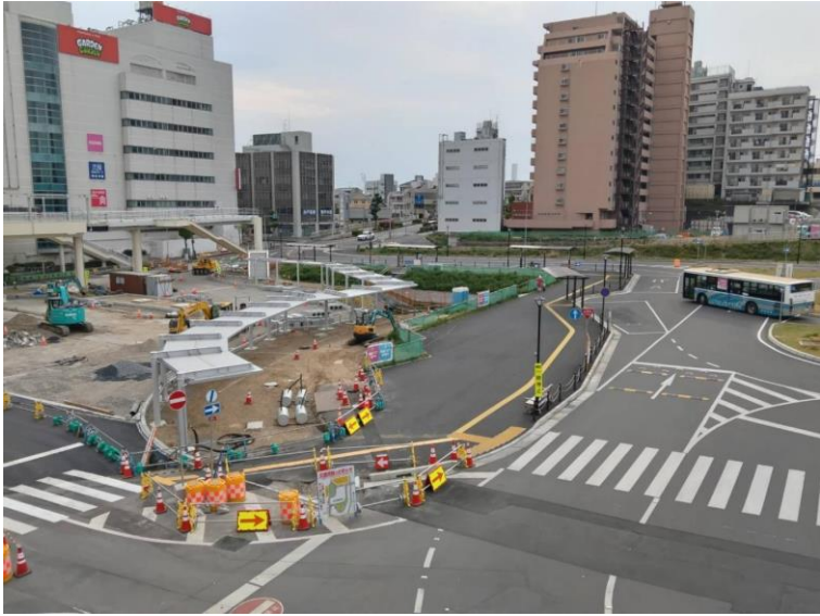
再開発事業が計画される仮設交通広場 左側奥が工事中の駅前交通広場(4月21日)