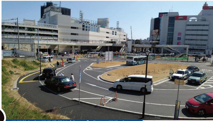
民間施行(再開発準備組合)で、「A街区再開発ビル」の建設が予定される取手駅西口A街区地区

取手駅西口前に民間が計画する「駅前開発ビル」への、取手図書館など「複合公共施設整備計画」の突然の発表(3月15日号取手市広報)に、市民の皆さんから「いつの間に」、「議会で決まった話もないのに」・・・驚きの声が上がっています。