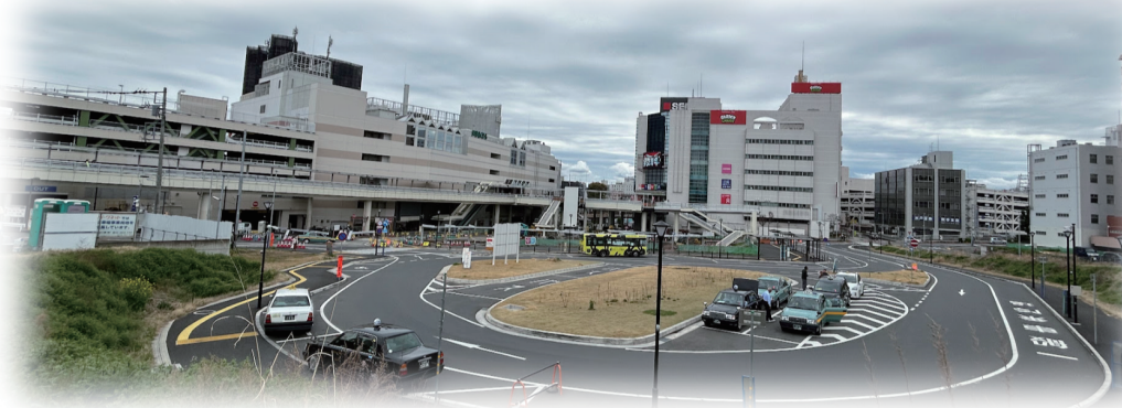
民間施行で再開発事業が計画される仮説交通広場（A街区） 奥の正面にリボンビル、左にアトレ（駅ビル） 4月4日撮影

市は、広報3月15日号に、取手駅西口前に地権者組合が施行する「A街区再開発ビル」に図書館などの「複合公共施設整備計画」を突然に発表しました。計画は、6.5ヘクタールの約220億円の事業費を要した区画整理（基盤整備）終了後のA街区（仮説交通広場）6000㎡に25階建て住宅棟と5階建て非住宅棟（公共施設、店舗、駐車場）を配置するものです。