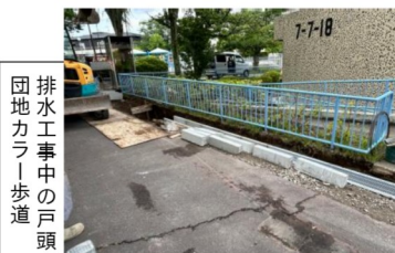
排水工事中の戸頭団地カラー歩道

＜その他＞・住み続けられる魅力ある街づくりについて。 ・借り上げ公営住宅など進捗・家賃補助制度創設・住宅の専門部課の創設。 ・政策のパッケージ化。 ・農業など質問しました。