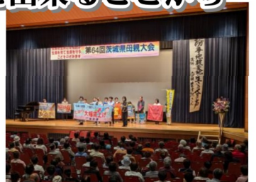
母親大会会場の常総市地域交流センター（豊田城）=6月8日

6月8日第64回茨城県母親大会が常総市で開かれ、約560人が参加。午前中は、6つの分科会（非戦の源流をたどる講談とお話、平和と教育、地域農業と食の未来、働き方、リトミック実践講座、常総市見学）が開かれ、どの分科会も大盛況で充実した内容でした。