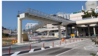
再開発停止で行き場を失った空中デッキ（6月17日撮影）