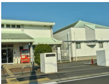
エレベーターの設置が切実に求められる井野公民館

6月議会以降3議員の辞職により議員は現在21名、3議席が空白です。党議員の一般質問は次の通りです。