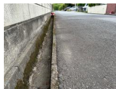
危険です市内各地にふたのない側溝が（写真は戸頭）