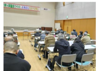
都市開発・社会教育の2人の専門家を招き駅前開発を考える会が2月に行った学習集会

急きょ発足した「取手駅前開発を考える会」は、市議会・教育委員会に請願署名を提出するなど。図書館等複合公共施設整備計画の中止・見直し、図書館関係者・ボランティア・市民参加による、取手市図書館構想の検討を要求。市民学習集会など市民の自覚的運動が広がっています。