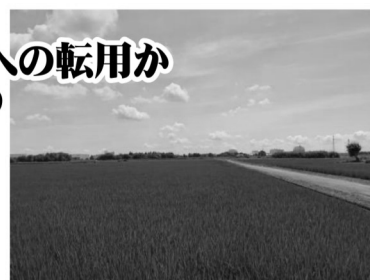
広い水田いっぱいに稲の緑が広がる桑原開発南側写真真奥右側に常磐線=7月8日撮影

○市街化への希望と農業持続の希望それぞれに寄り添う選択可能な計画への転換、農地の区画整理＝圃場整備も視野に大胆な変更見直しを図ることを求めます。