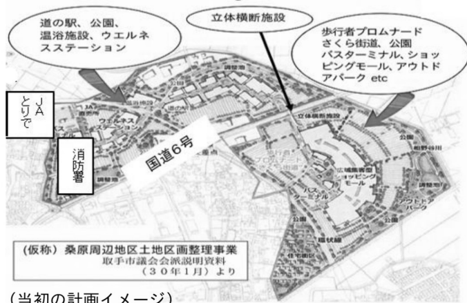
(当初の計画イメージ)