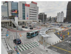
整備済みの駅前交通広場、写真奥にリボンビル

区画整理区域内(再開発区域 7000㎡)は、再開発事業施行予定の準備組合設立(2019年)前の2013年に建物移転・解体開始。日本共産党は「合意無き、先行き不明の移転解体、開発手法改めよ」と繰り返した。再開発事業への地権者の合意形成が進まない中でA街区工事の見切り発車が、地権者の同意をより困難なものとし、区画整理事業の遅延・事業費膨張をもたらしました。