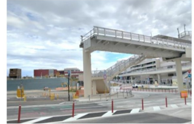
再開発の見直しにより、行き場を失った延伸整備済み歩行者デッキ